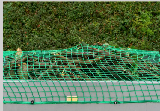
Sichern der Ware mit dem Netz